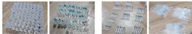
불법 투약한 프로포폴, 미다졸람