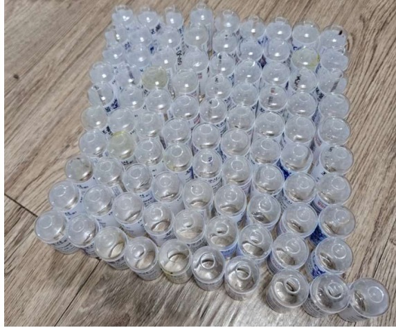
불법 투약한 프로포폴, 미다졸람